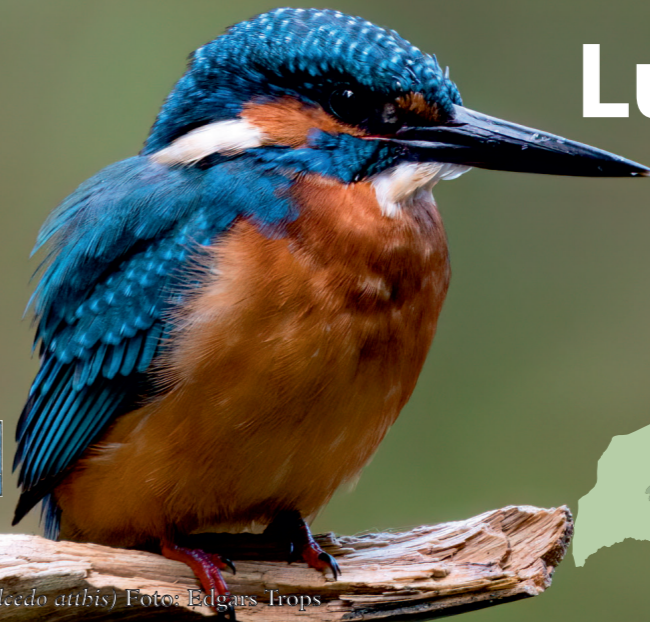
Jārlind (Alcedo atthis)